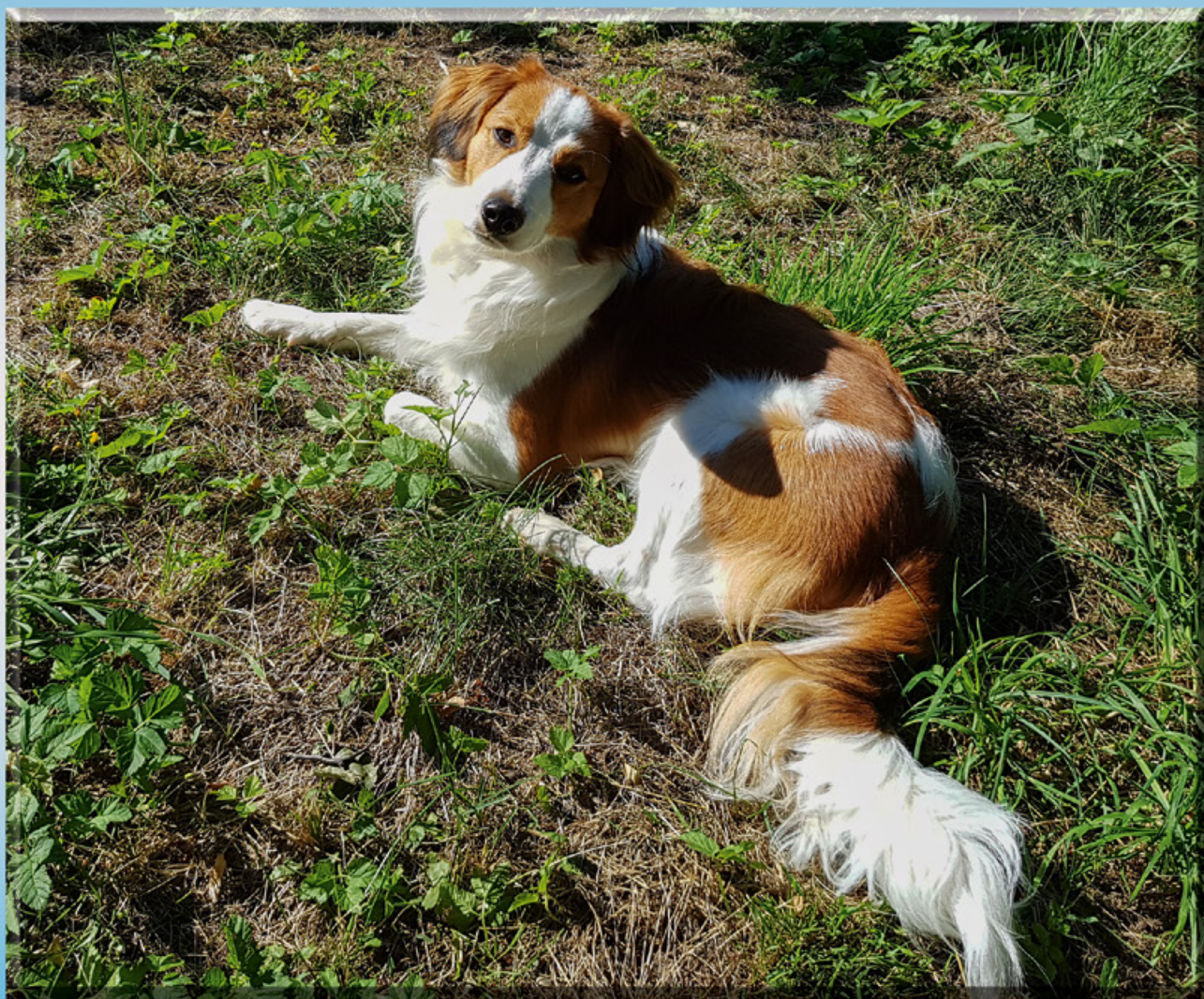
Titelbild: Casper aus der Elmstraße (gen. Cooper) Rasse: Kooikerhondje (FCI 314)